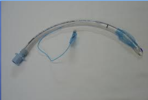
Tubo endotraqueal 96.04